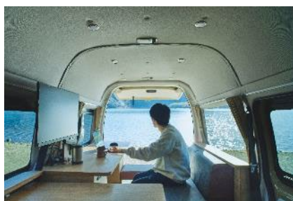
<mobica sand 車内から見える景色>