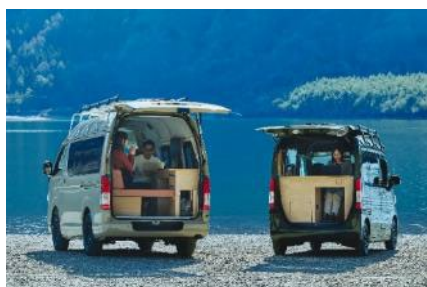
<左から mobica sand / forest>

働き方の柔軟性が求められる世の中で、従来のオフィスビルなどの「不動産」の中での働き方だけでなく、モビリティをオフィス化した「可動産※1」を利用することで、場所にとらわれず移動しながら自由に働くワークスタイルがあっても良いのではないかという考えから生まれたのが「mobica」です。