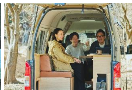
<チームビルディングにも最適>

「mobica」は約30年にわたって働く場をつくるオフィス事業を手掛けてきたGOOD PLACEが考えた、好きな場所へ移動しながら車内外で快適に働くことができるワーケーションカーです。車内にはコンセントやUSB電源が搭載されたポータブル電源を積載しているほか、Wi-Fiも完備しています。シートを倒してフルフラットにすれば、身体を横にできるベッドスペースが出現します。車両はハイエース（TOYOTA）とN-VAN（Honda）をワークスペースに架装した2種類展開で、利用人数に応じて選択できます。どちらの車両も業務や気分に合わせて自由に働くスペースを選び、カスタムできる仕様です。